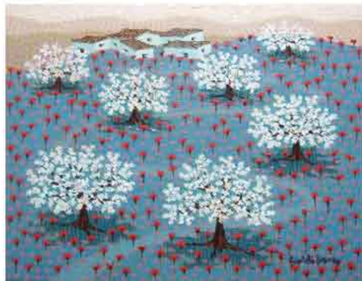
CAMINO HACIA LA ALDEA Óleo sobre lino 27 x 35 cms. Año 2011

La noche, cálida y expectante, se derrama sobre la pintura de Evaristo Guerra. El aire se ha quedado quieto, bautizado por una paz telúrica, y la luna escruta con su resplandor azulado o rosáceo un aire que se intuye tibio como una placenta. Las palmeras abortan en su sueño vertical, los matorrales que condecoran las colinas, las luces que asoman como animales agazapados en algunas puertas y ventanas de esa construcción de paredes blancas (quizá una modesta iglesia, quizá un albergue para peregrinos, quizá un oasis del alma), todo parece anticipar en su exacto mutismo el advenimiento de una gloria que aún no se atreve a mencionar su nombre. Evaristo Guerra ha posado su mirada primigenia sobre este paisaje real o imaginario y le ha sabido contagiar un temblor recóndito, una estrategia de serenos anhelos, una solemnidad milagrosamente modesta. Quizá pronto amanezca sobre las colinas.