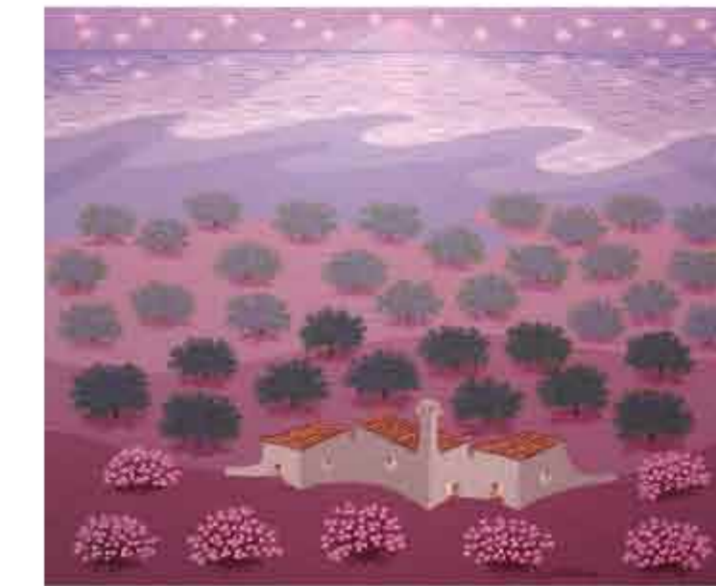
NOCHE ESTRELLADA Óleo sobre lino 50 x 61 cms. Año 2011

El camino de Evaristo Guerra fue largo hasta encontrar el lenguaje que lo caracteriza: un dibujo lineal, fuerte, de formas esquematizadas y pincelada minuciosa, la cual va tejiendo y sensibilizando cada partícula del cuadro, como si fuera un tapiz. Se trata de un estilo de colores brillantes, muy contrastados, florecientes y de luces matizadas, capaces de transfigurar el mundo circundante en un universo interior, un punto mágico, en una pintura poemática de cerros superpuestos, a los que un trazado insistente de surcos va dando una suerte de huellas dactilares intrasferibles. Caminos serpenteantes atraviesan esta campiña intimista y conducen a cortijos cerrados y a pueblos altivos.