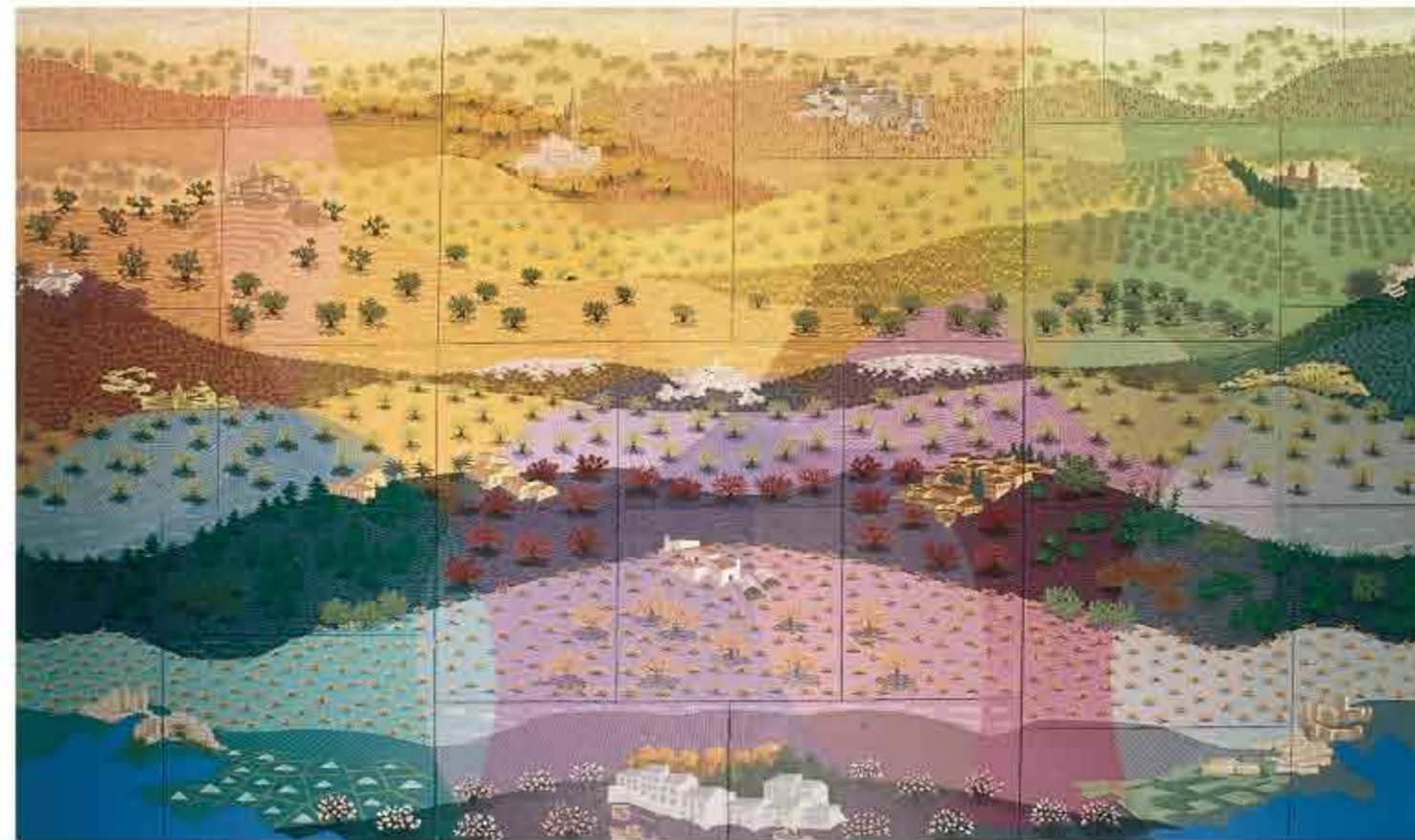
HOMENAJE A LA LUZ DE ANDALUCÍA Óleo sobre lino 280 x 486 cms. Año 1995-2011