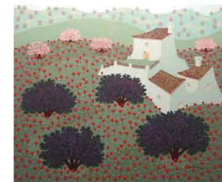
AZOTEA PARA SOÑAR Óleo sobre lino 60 x 73 cms. Año 2011

El río va de la Sierra a la vega, corta ésta y señala su paso con mil caserías, con hazas pequeñas, con arbolados frutales, los que da la altura y el clima, -higueras, granados, moreras, nogales-. Más allá donde el río cesa, las hazas se agrandan, las caserías se convierten en cortijos, los olivos sueltos, en serios ordenados olivares. No hay agua que riegue y hay que dejarle el trabajo a la tierra y el sol y a la lluvia, poca o demasiada, que el cielo quiera mandar.