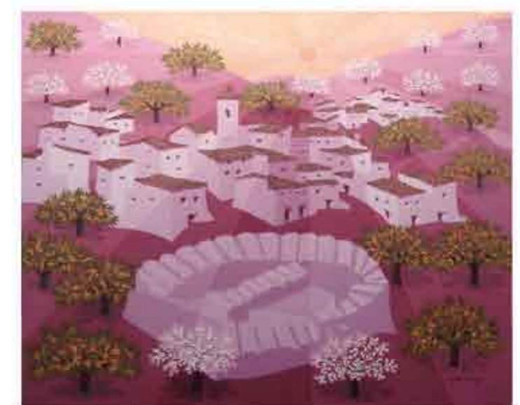
SAYALONGA Óleo sobre lino 65 x 81 cms. Año 2011