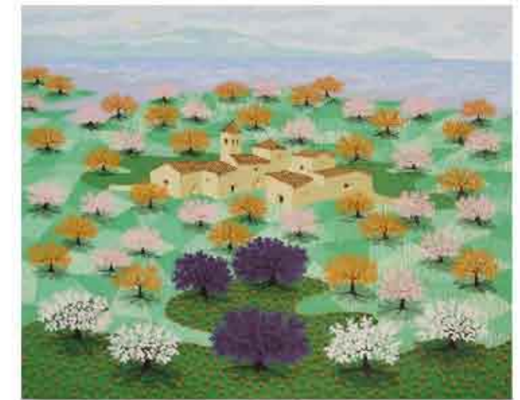
ANDALUCÍA EN MI RECUERDO Óleo sobre lino 81 x 100 cms. Año 2007