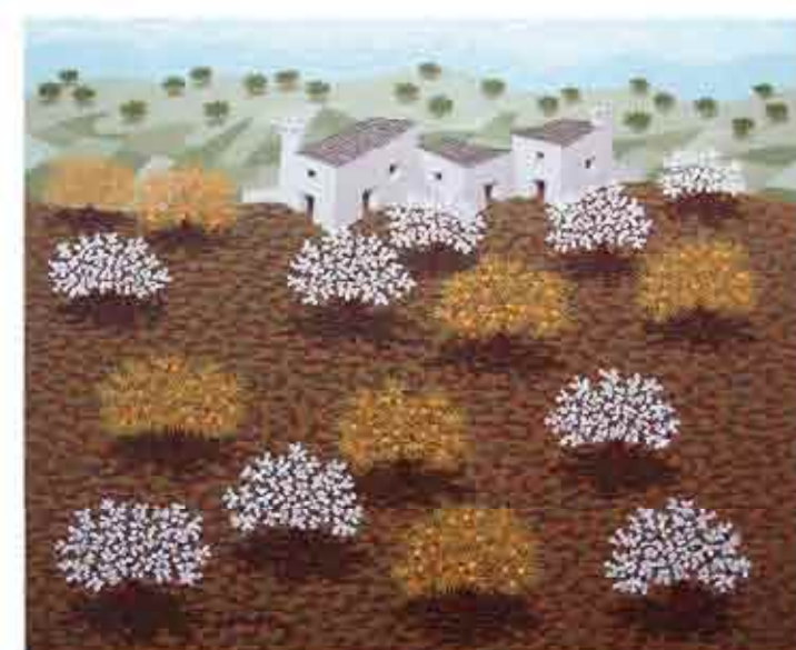
TARDE ABRILEÑA Óleo sobre lino 60 x 73 cms. Año 2010