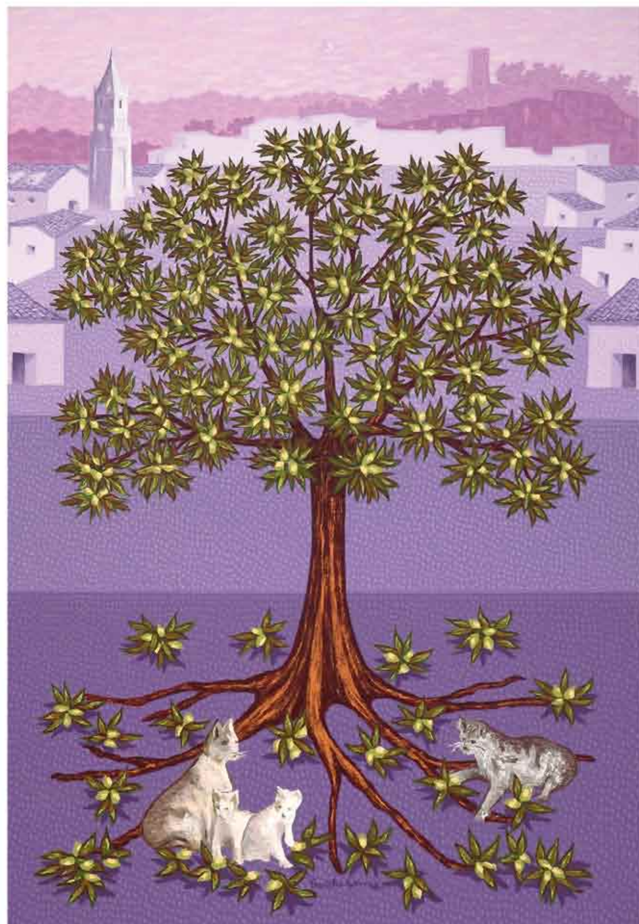
SUEÑO DE MARÍA ZAMBRANO